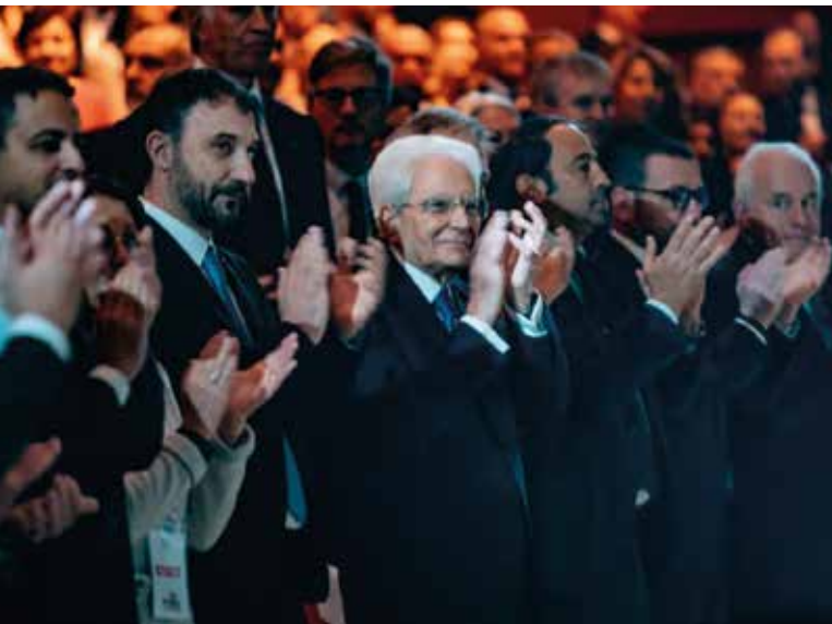
Il presidente Sergio Mattarella alla celebrazioni per gli 80 anni delle Acli nazionali a Roma lo scorso dicembre.

l'anno in cui devono essere condonati tutti i debiti, devono essere liberati gli schiavi, devono essere ridistribuite le terre.